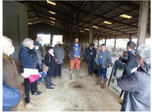
▲ Visite exploitation agricole (Neuvy St-Sépulchre)

Enfin, à la suite de cette visite, le bureau de la Fédération des PNR étudie le projet et rend son avis. Il en est de même du CNPN qui complète lui par une audition des porteurs du projet qui a eu lieu le 17 novembre en visioconférence .