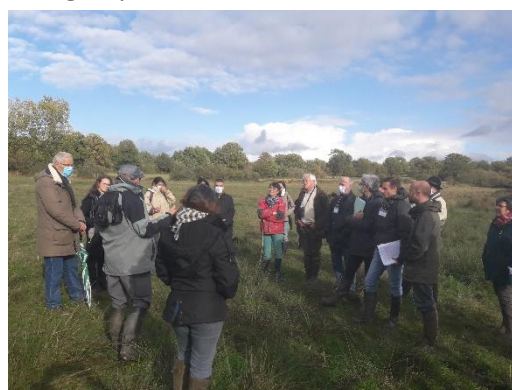
▲ Arrêt sur prairies humides (Crozon-sur-Vauvre)

Dans ce cadre, le territoire candidat doit organiser une visite de 2 jours à destination des rapporteurs nationaux . Celle-ci a eu lieu les 13 et 14 octobre 2020 . Une délégation locale composée des élus référents des Pays et de la Région accompagnés des techniciens référents a accueilli une délégation nationale de 7 personnes. Malgré une météo peu favorable et un planning chargé, la visite s'est bien déroulée. Elle comprendait 12 sites ou points d'arrêts ou temps d'échanges permettant d'aborder autant de thèmes, tels que : agriculture, bocage, biodiversité, problématique de l'eau, culture et éducation à l'environnement, économie autour de l'artisanat d'art, culture immatérielle berrichonne et biodiversité domestique, protection de sites naturels, développement touristique... A chaque arrêt il a été présenté les richesses, les fragilités, les enjeux et une discussion autour des plus-values possibles du PNR.