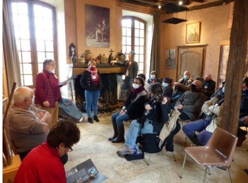
▲ Au Château du Plaix (St-Hilaire en Lignières) : patrimoine immatériel et vivant berrichon

En plus de la délégation, ce sont 52 intervenants locaux qui ont été mobilisés . Et nous en profitons pour les remercier à nouveau de leur implication dans cette organisation.